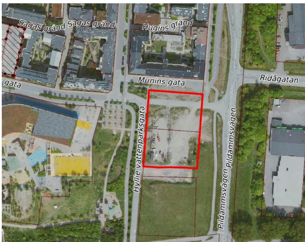
Orienteringskarta, flygfoto från 2025. Område som omfattas av planändringen är fastigheterna Tårtljuset 1 och 2 inom röd markering.